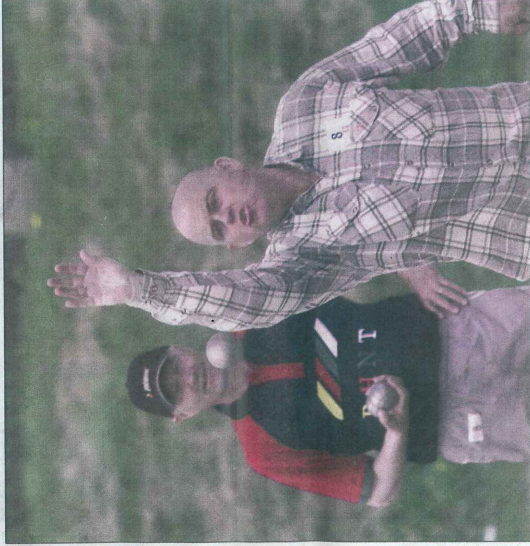
NM: Det blir ventelig mange spennende dueller når landets beste petanque-spillere møtes i NM på Tollboden.